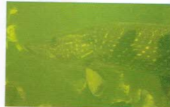
Snoek 'Muurbloempje'

Bureau Stadsnatuur Rotterdam (bSR) onderzoekt in opdracht van de gemeente Leiden sinds 2006 tweejaarlijks de stadsnatuur. Sinds 2008 worden in zestien watergangen de vissen geïnventariseerd, waarbij gebruik wordt gemaakt van schepnetten. De grachten van de Havenwijk-Zuid worden echter niet bemonsterd. En inventarisatie m.b.v. schepnetten levert ook heel andere resultaten op dan de snorkelmethode, omdat bij die laatste techniek de dieren redelijk ongestoord in hun eigen biotoop worden geobserveerd. Een leuk voorbeeld van dit verschil is dat bSR's 'gemiddeld gevangen' zeelt 5 cm is en dat de door Aaf geobserveerde zeelten gemiddeld zo'n 40 cm lang zijn! De gevolgde snorkelmethode is (in elk geval voor Leiden) uniek. Aaf stuitte daarmee wel op een probleem: volgens de Algemeen