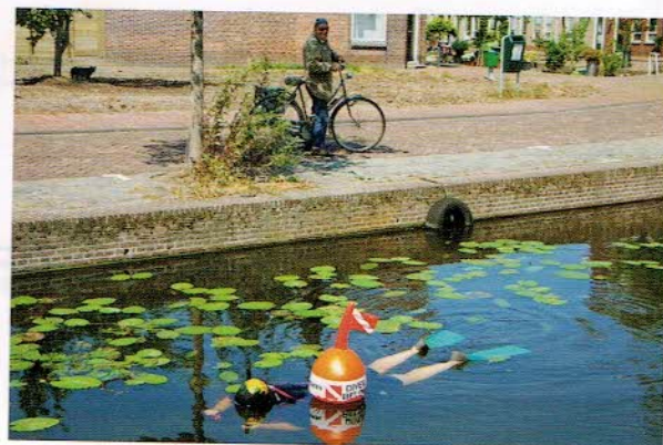
Op zoek naar vissen