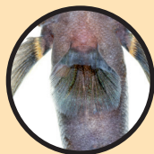
Buikvinnen vergroeid tot zuignap

Let als je een grondel ziet of vangt op een combinatie van onderstaande kenmerken, check de herkenningskaart en maak foto's: